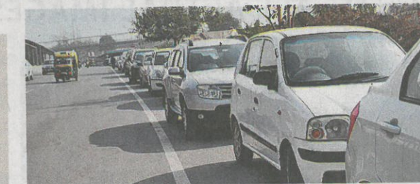
राजीव चौक के समीप कोर्ट रोड पर सड़क पर बनी वाहनों की अवैध पार्किंग

जासं, गुरुग्राम: राजीव चौक के नजदीक सड़क पर वाहनों की अवैध पार्किंग होने से सड़क पर ट्रैफिक जाम लग रहा है। खास बात यह है कि जिस जगह पर वाहनों को सड़क पर खड़ा किया जा रहा है, वह साइकिल ट्रैक है। वाहनों की अवैध पार्किंग होने से सड़क संकरी हो गई है और सुबह-शाम के वक्त सड़क पर ट्रैफिक लोड होने के दौरान राजीव