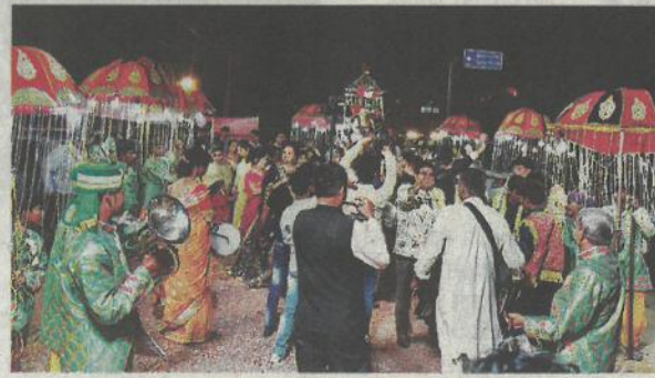
देवोत्थान एकादशी के अवसर पर शुभ मुहूर्त के दिन शुक्रवार हो रहे एक विवाह समारोह में बारात में बैंड बाजे की धुनों पर नाचते गाने लोग

नवरात्र, दीपावली और छठ के धार्मिक उत्सव के बाद शहर के एक बार फिर से उत्सवी हो उठा। सड़कों पर बारात के बैंड बाजे और लाइट से रौनक रही है। दिल्ली रोड, शीतला माता रोड और अशोक विहार के तमाम बैंकवेट हॉल शुक्रवार को ब्रुक थे। कहीं देशी रजवाड़े के तर्ज की सजावट थी तो कहीं विदेशी आर्किड, जरबेरा जैसे फूलों की मदद से पाश्चात्य पद्धति की सजावट। इस नई साज सज्जा के बीच बैंड वाले पुराने गीतों की धुन से शहर को नए पुराने के मेल का जैसे संगम बना रहे थे। बैंड वाले डांस नंबर के साथ-साथ आज मेरे यार की शादी है... यार की शादी है मेरे दिल दार की शादी है... बहारों फूल बरसाओ मेरा महबूब आया है... जैसे पुराने गीतों के धुन पर लोगों दुल्हे के पिता से लेकर भतीजे तक को नचा रहे थे तो वही